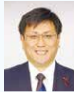
たのかしら ちくぬき たのかしら知行 (公明)博多区