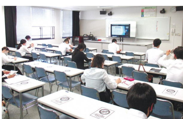
教員への特別支援教育研修の様子

問 感染症が収束に向かった場合などには、事業者の事業継続につながる消費喚起や交流人口の回復につながる支援策を積極的に実施してもらいたい。感染拡大防止と経済活動の両立に向けて、事業者等への支援にどのように取り組んでいくのか。