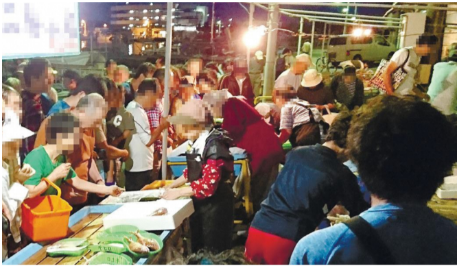
魚を買う市民でにぎわう浜の朝市

問 魚がおいしいまちに住んでいる私たち市民が、生産者支援に直結する魚食を行い、お魚応援団として本市水産業が今後盛り上がるように取り組んでもらいたい。本市水産業をどのように振興していくのか。