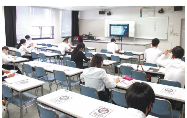
教員への特別支援教育研修の様子

問 自治体でのRE100の実現には、購入電力を再生可能エネルギー100%にすること