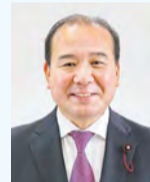
くろこ ひでゆき 黒子 秀勇樹 (公 明)早良区