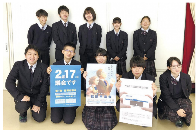
博多工業高等学校画像工学科の生徒の皆さん

次の議会(定例会)は2月17日開会予定です。日程は市役所・区役所・出張所・地下鉄駅構内のポスター、市議会ホームページやTwitterに掲載します。